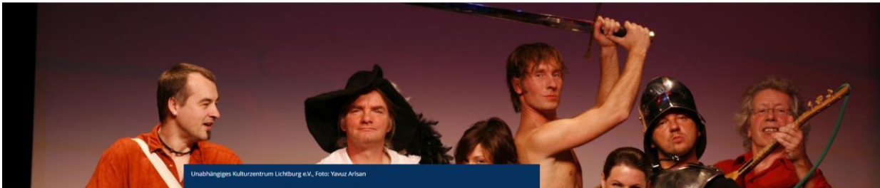
Unabhängiges Kulturzentrum Lichtburg e.V., Foto: Yavuz Arisan

Startseite > Kulturförderung & Kulturpartnerschaften